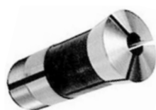
Тип 369 E (R8)