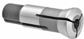
Тип 385 E (5C)