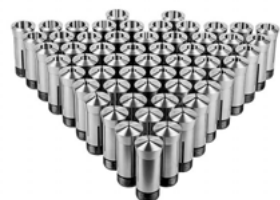
Набор цанг 385 E (5C)